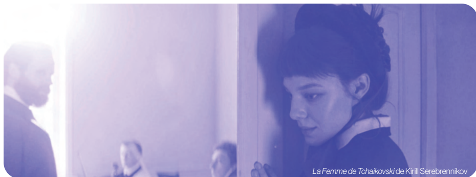
La Femme de Tchaïkovski de Kirill Serebrennikov