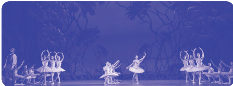
Don Quixote ©2019 ROH, Photographed by Andrej Uspenski