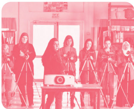
Cinéma Sabaya de Orit Fouks Rotem

Nous choisirons un film qui permettra l'ouverture, la surprise, la rencontre et principalement un film jamais distribué en France ou qui a bénéficié d'une visibilité réduite lors de sa sortie.