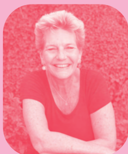
Sophie Dulac