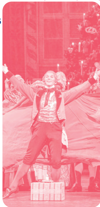
The Royal Ballet ©2022 Asya Verzhbinsky