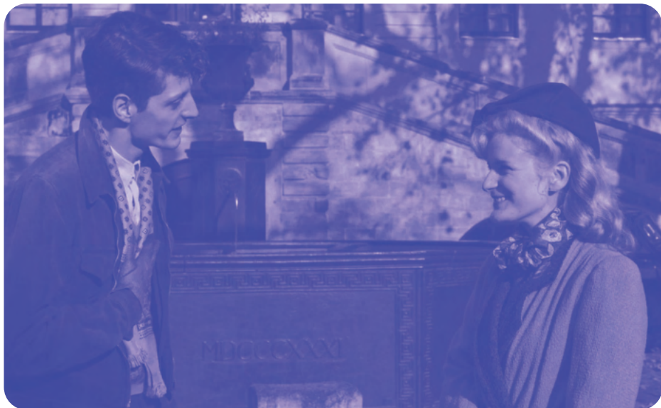
L'Origine de la violence de Elie Chouraqui