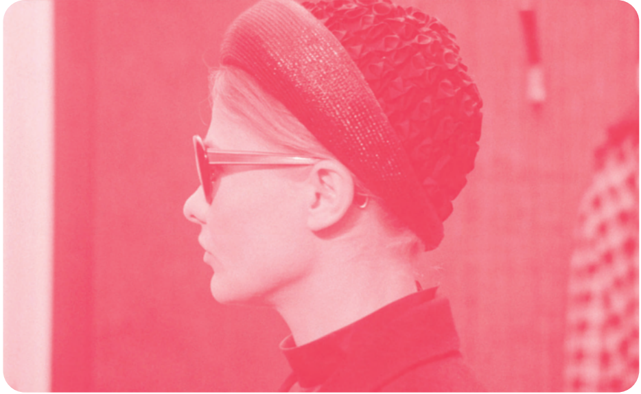
Binding Sentiments de Márta Mészáros