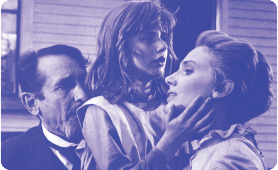
Miracle en Alabama de Arthur Penn