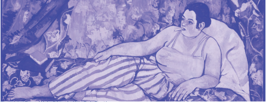
Un monde à soi, Suzanne Valadon