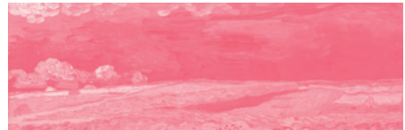
Champ de blé sous un ciel orageux, Auvers-sur-Oise, juillet 1890 Van Gogh Museum, Amsterdam (Vincent van Gogh Foundation)

culturels, des artistes, des lieux... La saison nous conduira à examiner les arts et la danse, c'est-à-dire comment les artistes du XXe siècle se sont attachés à développer leur création autour des arts de la danse. Nous irons également de Rome à Dresde, de Marly à Londres, tout en continuant l'exploration des grandes expositions... un nouveau voyage dans le monde artistique.