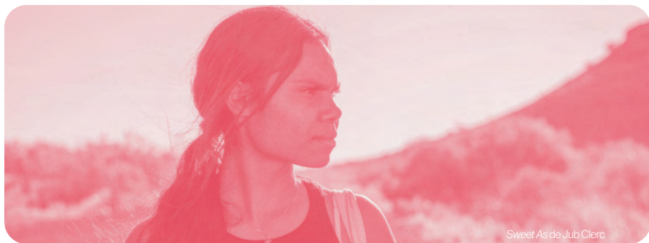
Sweet As de Jub Clerc

L'ambition de ce festival est de mettre en lumière le meilleur du cinéma français et international à travers une sélection plurielle de films audacieux et mémorables.