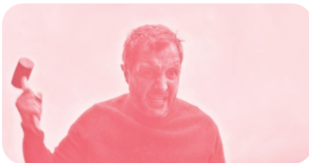
Vincent doit mourir de Stephen Castang

Nicolas Martin reçoit à chaque séance un invité ou une invitée pour échanger autour du film avec le public avant de poursuivre tous ensemble la discussion au bar de l'Arlequin.