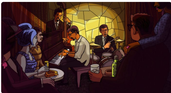
They Shot the Piano Player de Fernando Trueba et Javier